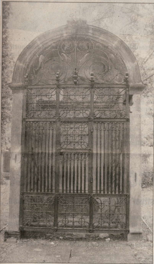
Das Todenwartsche Totenhaus auf dem Alten Friedhof.